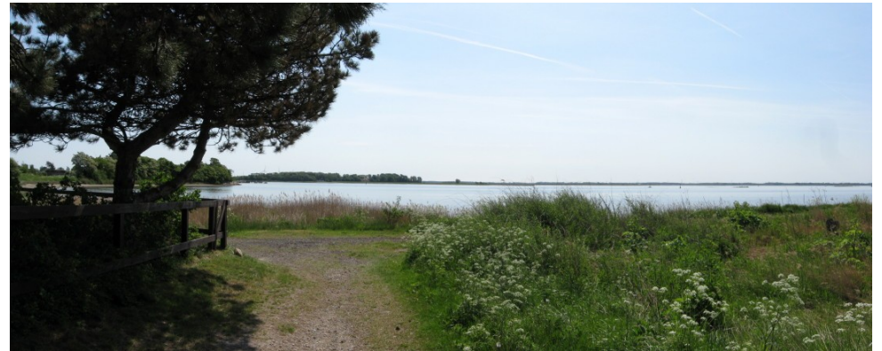
Udsigt til Vigelsø

Bemærk: Galleriet, huset og haven har trods alt begrænset plads og der er ret lavt til loftet. Stedets muligheder for overnatning er to mindre værelser samt to separate rum i galleriet. Skulle vejret være i mod, rejses der to store pavilloner i haven på hver 24 m 2 , hvor under der kan foregå aktiviteter og hvor under der også kan slås telte op.